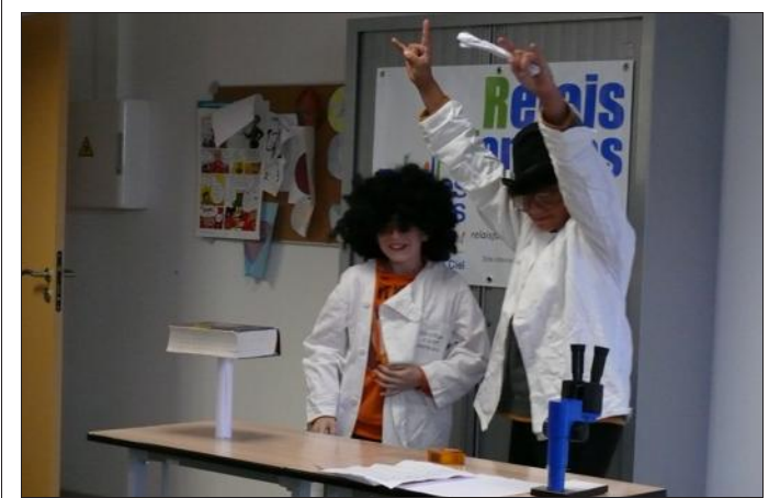
■ Le dictionnaire tient sur une feuille

L'après-midi s'est terminée par le partage d'un sympathique goûter.