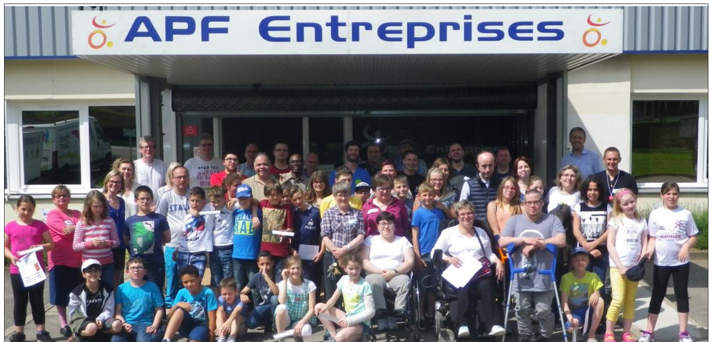
■ Une journée riche en rencontres et en émotions

Dans un deuxième temps, ils ont assisté à des rencontres handisports. Des démonstrations de tennis fauteuil, de parcours fauteuil, de parcours sarbacane, de carabine laser, de handi bike ont surpris les jeunes spectateurs.