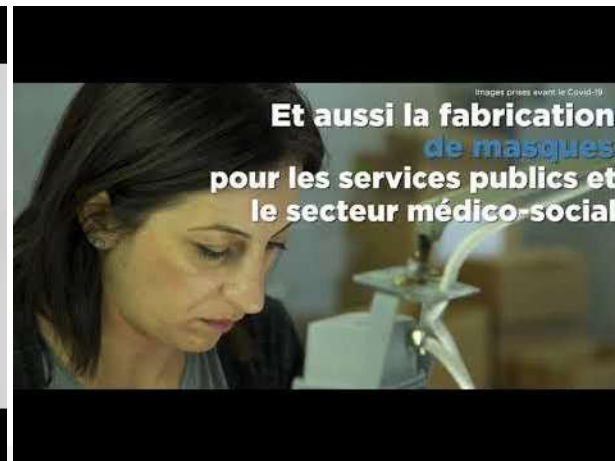
Maintien d'activités essentielles