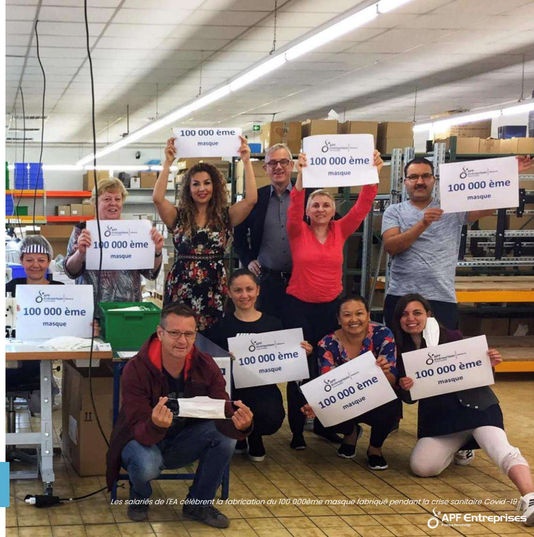
Les salariés de l'EA célèbrent la fabrication du 100.000ème masque fabriqué pendant la crise sanitaire Covid-19

Aujourd'hui, c'est presque 30 activités que nous déployons à travers nos 25 entreprises adaptées réparties sur tout le territoire national et plus d'une cinquantaine de fonctions.