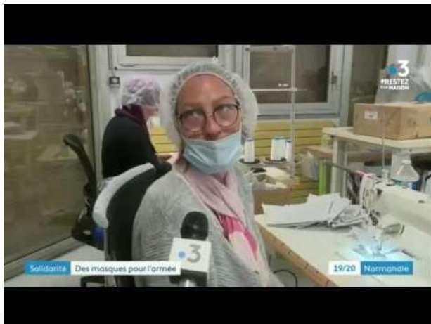
Fabrication de masques homologués