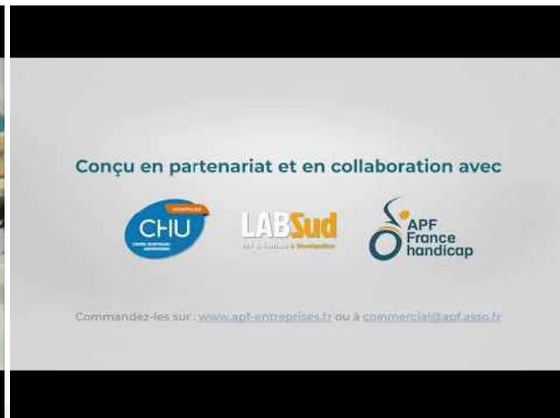
Fabrication de visières de protection